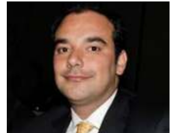
Horacio José Serpa Moncada

Solicitó información soportada sobre el Convenio 1029 de 2010, Plan Maestro de Movilidad para el D.C. y conocer los perjuicios para la ciudad en el retraso de la implementación del SITP. DPC 583-14